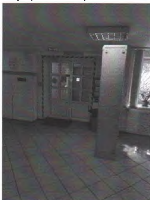
Фото 2. Центральный выход из общежития