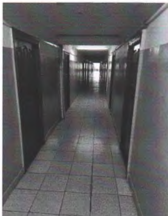
Фото 4. Коридор 2-го этажа без противопожарной перегородки