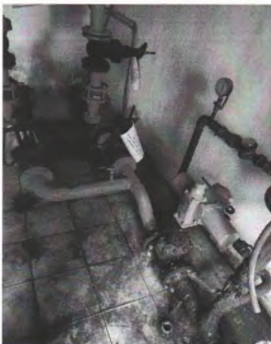
Фото 3. Помещение насосной