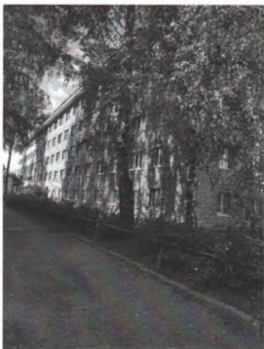
Фото 1. Вид на здание общежития

(Здание общежития № 3 ФГБОУ ВО «РГАТУ» по адресу: г. Рязань, ул. Вишневая, д. 35).