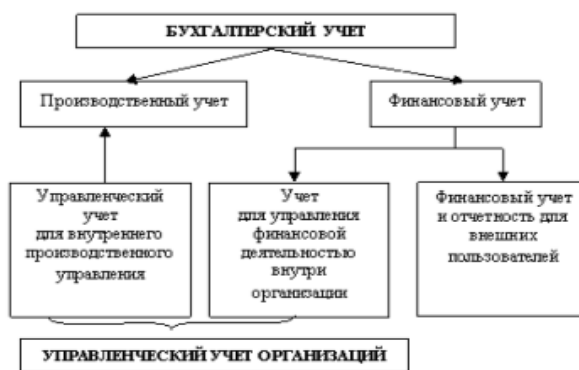
Рис. 1 – Взаимодействие финансового и управленческого учета