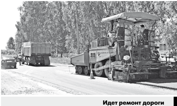
Идет ремонт дороги

Конечно, за прошедшие годы многие составляющие архитектурного ансамбля исчезли или превратились в руины. Однако конный завод сохранился. Он и сегодня занимается воспроизводством лошадей и их содержанием. В годы гражданской войны на уже национализированном Старожиловском кон-