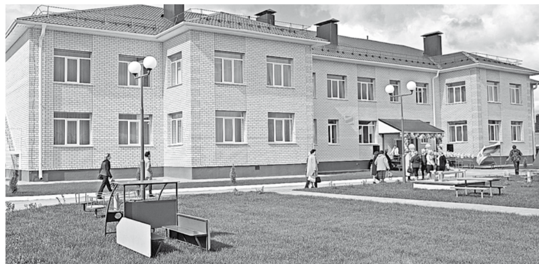
Детский сад в д. Хрущеве

сохранилась доменная печь, построенная по указу Петра I в 1715 году для производства игл. С 2011 года возле этого памятника архитектуры проходят международные кузнечные фестивали. Есть и другие сохранившиеся исторические строения, которыми когда-то славился наш край. Много знатных имен наших земляков вписано в историю страны. Гостей и жителей райцентра встречает памятник знаменитому на весь мир мореплавателю, дважды совершившему кругосветное путешествие, Василию Головинну. Но, пожалуй, главное богатство района — это люди. О них можно рассказывать до бесконечности.