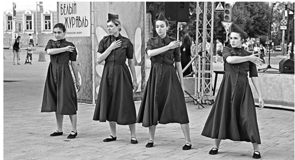
Танец «Месяц май»