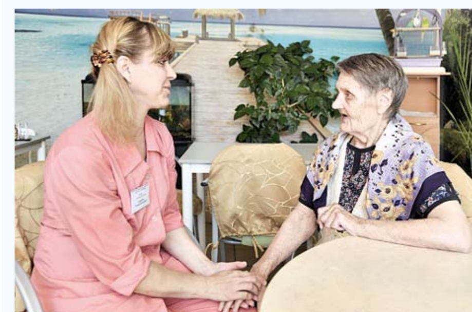
Один из проектов, удостоенных Президентского гранта, посвящен социальному обслуживанию пожилых людей