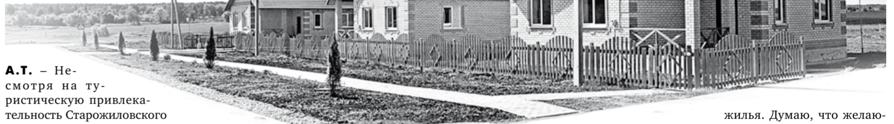
В новом поселке с. Гребнево