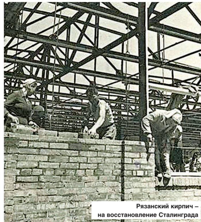
Рязанский кирпич – на восстановление Сталинграда