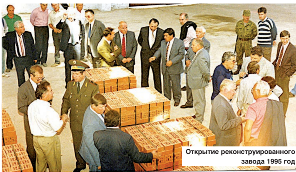
Открытие реконструированного завода 1995 год

лесниковой в течение последней декады апреля месяца выделить двести тысяч лучшего качества кирпича Роснабсытту для отправки в Сталинград...»