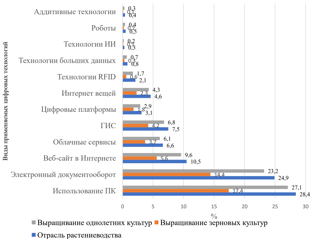
Рисунок 2 – Показатели цифрового развития отрасли растениеводства РФ в 2024 году, в %-х от общего количества организаций АПК