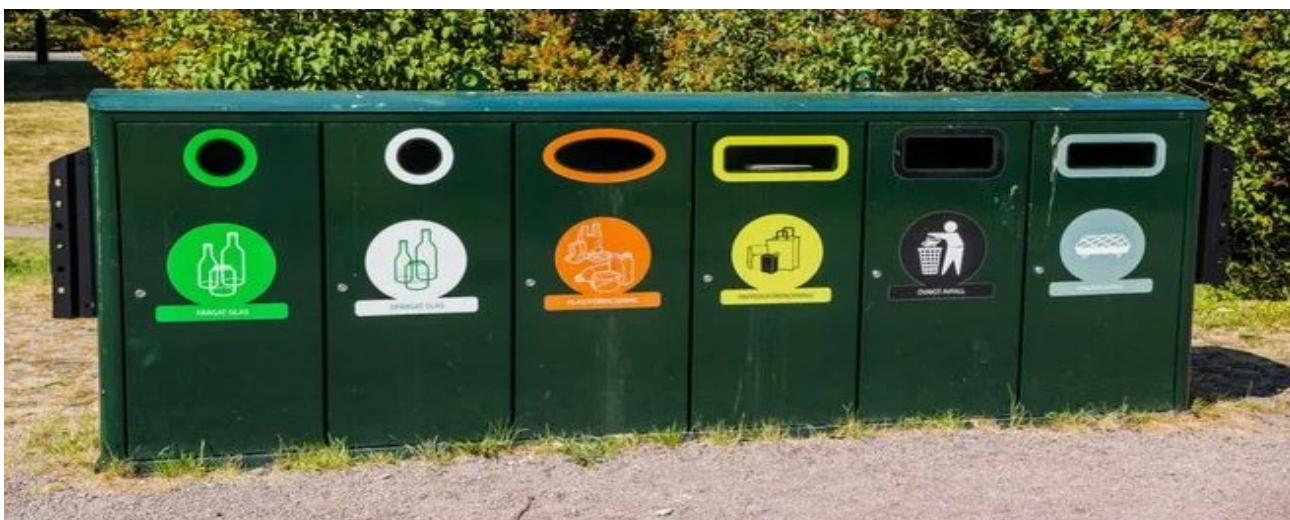
Рисунок 1 – Специализированные баки для отдельного сбора разнотипного мусора

Самый популярный способ сбора бытовых отходов в Швеции – это размещение у каждого дома специализированных контейнеров соответствующего назначения со своими приемными окнами и цветными эмблемами, соответствующего назначения – рисунок 1.