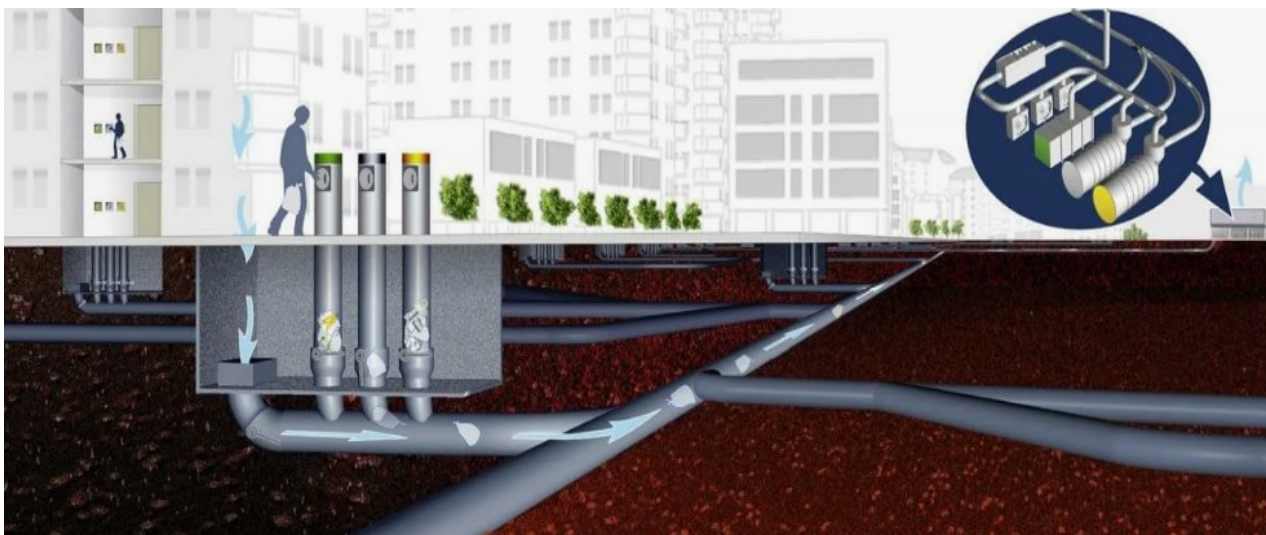
Рисунок 2 – Подземный воздуховод для переноса мусора в центральную станцию приема

Принцип его работы заключается в следующем. Верхняя часть – урна – расположена над землей, а под землей находится основная часть урны, в которой накапливается весь мусор, поступивший из надземной части. Под землей установлена система герметичных труб из углеродистой стали диаметром 0,5 метра, ведущих на станцию сбора мусора. Несколько раз в сутки воздушным потоком накопившийся мусор всасывается со скоростью 70 км/ч в центральную станцию приема мусора, где он прессуется и направляется либо на переработку, либо на сжигание. Стоит отметить, что сама станция может быть расположена довольно удаленно - на расстоянии до нескольких километров [5, 6]. Этот способ имеет ряд значительных преимуществ: