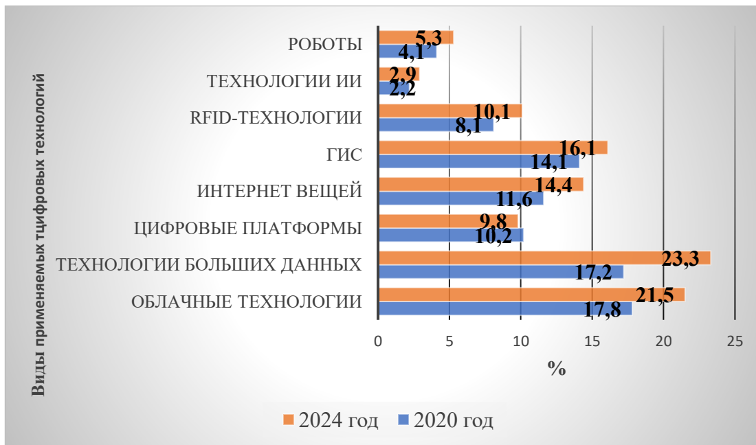
Рисунок 1 – Динамика показателей цифрового развития в организациях сельского хозяйства в РФ за 2020-2024 гг., в %